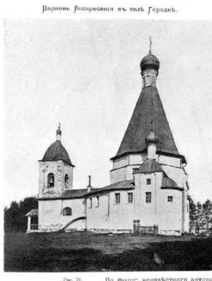
Рис. 72. По фотог. неизвестного автора.

Две двери: одна, ведущая на паперть, а другая в самый храм, обе железные, окрашенные зелёной краской.